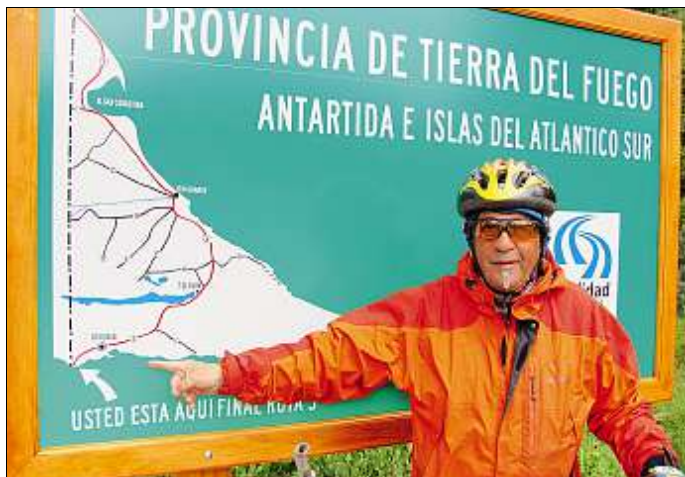
USHUAÏA. En Amérique du Sud, la route argentine n° 3 s'arrête au bout du parc national Lapataia à Ushuaïa