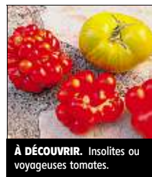
À DÉCOUVRIR. Insolites ou voyageuses tomates.

En voilà une autre, bien plus délicate : La rose de Berne. Oui, elle est vraiment rose, de taille moyenne. On la reconnaît du premier coup d'œil et il est d'ailleurs recommandé de la surveiller, car sa peau très fine se fend rapidement. Très douce, elle plaît à tous les palais craignant l'acidité et se déguste en salade que cuisinée. Changement de couleur : La noire de Crimée, très foncée, à gros fruits ; sa chair est égale-