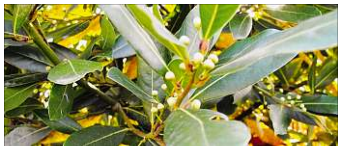
SYMBOLE. Le laurier, le bon goût couronné.

Dépité, le bel Apollon détourna la situation à son avantage. Il s'attribua ce bel arbre comme symbole absolu de sa gloire, l'associant à ses triom-