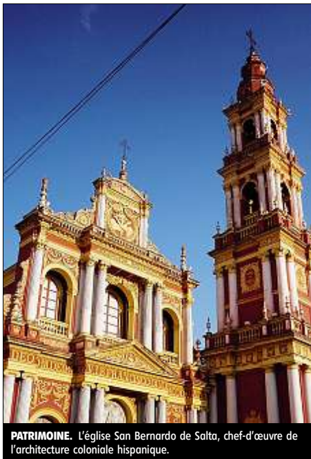
PATRIMOINE. L'église San Bernardo de Salta, chef-d'œuvre de l'architecture coloniale hispanique.

Ma route elle file souvent en longues lignes droites de 70 km qui ondulent à travers des plateaux désertiques de sel, les grandes salines de Jama, de sable à Amaicha del Valle, de rocs recuits par le volcanisme à Hualfin ou entre des taillis rabougris parsemés de « cardones », cactus candélabres, vers San Juan. La