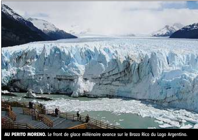
AU PERITO MORENO. Le front de glace millénaire avance sur le Brazo Rico du Lago Argentino.

La nature donne ici en son et lumière l'un de ses plus beaux spectacles. Quelques craquements sourds déchirent le mur de glace comme soudain atteint par un orage fantôme. Des aiguilles bleutées se détachent et basculent dans l'eau turquoise. Un coup de canon sec et puissant accompagne, décalé, la chute. Une énorme gerbe d'eau est projetée jusqu'aux cimes figées et tout redevient calme. Seul un iceberg bleu électrique,