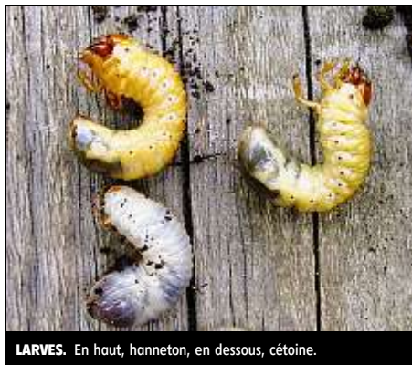
LARVES. En haut, hanneton, en dessous, cétoïne.

Avant d'estourbir ce petit monde, prenons le temps de l'examen : Il peut s'agir de larves de cétoïne dorée, ce bel insecte qui apprécie tant le cœur des roses... et qui sont, contrairement, aux premières, inoffensi-