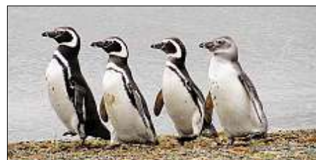
J'AIME LE PAS DES MANCHOTS DE MAGELLAN. Une colonie de manchots de Magellan occupe l'île de Punta Tombo à l'entrée est du canal de Beagle.

J'aime pas les fermetures éclair qui coïncent ; crever ; les scorpions sous la tente ; les moustiques d'Abancay ; la chaleur des déserts ; la plomberie bolivienne ; les chiens agressifs ; les voleurs ; les graviers et le sable sur les routes ; les très longs lignes droites ; la signalisation fantaisiste ; les décharges sauvages et le vent de face. ■