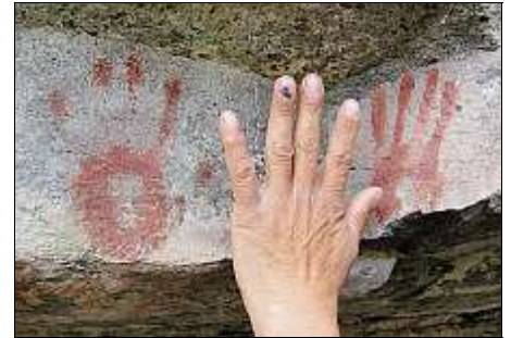
LES MAINS DE CERRO CASTILLO. 9000 ans avant notre ère, l'homme vivait dans la vallée de Cerro Castillo au Chili

Ce sont celles d'un homme Patagon de haute stature qui maîtrise parfaitement l'art de la chasse, de la pêche et la taille des silex abondant tout autour. 9000 ans plus tard, l'homme moderne veut noyer la vallée par un barrage pour obtenir l'énergie électrique dont il a besoin. Moi, je vois dans ta peinture un message d'amour, une main tendue vers les générations futures. Elles auront bien besoin de ton coup de mains! ■