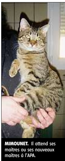
MIMOUNET. Il attend ses maîtres ou ses nouveaux maîtres à l'APA.

Et toujours beaucoup, trop de chats qui attendent une famille... ■