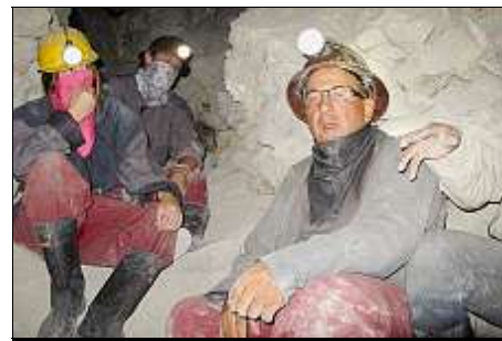
MINEURS S'ABSTENIR... À Potosi, mine défaite, le cyclopede est à 60 m sous terre, où l'on exploite le minerai d'argent.

Habillés en mineurs de fond dans un local sordide, j'atteins bientôt en bus les hauteurs de la Cerro Rico rouge qui domine Potosi.