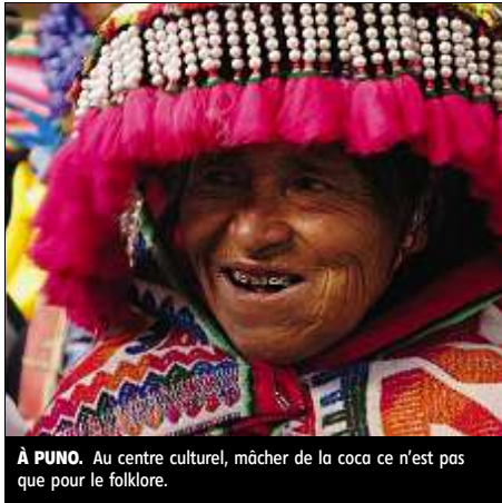
À PUNO. Au centre culturel, mâcher de la coca ce n'est pas que pour le folklore.

La ville a cependant un charme tout particulier. Ses rues pavées, sa place d'armes aux arcades de granit surmontées de balcons en bois colorés, sa cathédrale et l'église San Sebastian, patron de la ville, sont particulièrement mises en valeur la nuit. Ici on est très croyant et les églises font le plein d'une foule bigarrée toute tour-