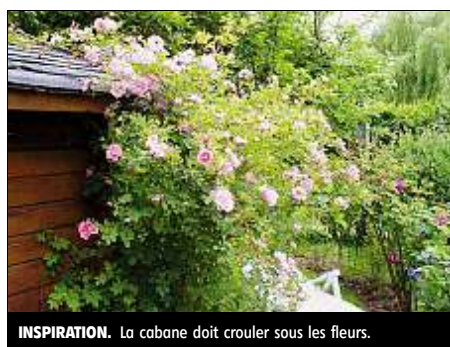
INSPIRATION. La cabane doit couler sous les fleurs.

Il y aurait des buis en boule, en carré, en fuseau,