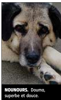
NOUNOURS. Douma, superbe et douce.

Douma n'est ni méchante, ni agressive. Douma n'aboie pas inutilement. Non, Douma est simplement un berger d'Anatolie. Autant dire que côté présence, elle ne craint pas la concurrence. Cette superbe chienne a été trouvée à Saint Clément sur Régnat, non identifiée, ni par puce électronique, ni par tatouage. Le refuge de l'Association Protectrice des Animaux, à Gerzat, n'a donc pas pu retrouver ses propriétaires. Douma est affectueuse, sociable et indépendante. Pourtant, elle inquiète l'équipe du refuge qui la trouve de plus en plus triste... Elle a six ans. Comme tous les animaux du refuge proposés à l'adoption, elle est stérilisée, identifiée par puce électronique et à jour de