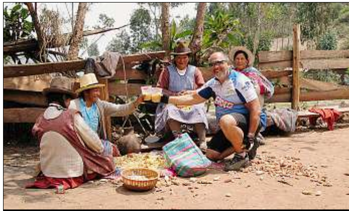
UN VERRE DE « CHICHA ». Le maïs est un des aliments de base au Pérou.

En quittant Nazca, je sais qu'elle est là, toute proche noyée dans la brume matinale. La Cordillère m'accueille comme une « mama » sans m'effrayer. Ses pentes sont douces et ses grandes courbes m'enlacent. Elle me prend contre ses rondeurs. Encore Sierra, de ballon en ballon elle m'élève peu à peu majestueusement sans se dévoiler. L'altimètre s'affole, 2.000, bientôt 3.000 et ça monte toujours. Le souffle est court et les jambes