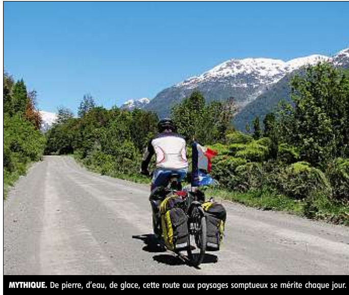
MYTHIQUE. De pierre, d'eau, de glace, cette route aux paysages somptueux se mérite chaque jour.