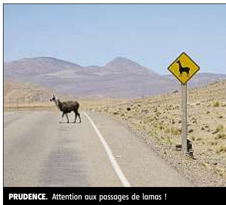
PRUDENCE. Attention aux passages de lamas !

Je choisis de rejoindre Ururo par bus pour éviter le flot ininterrompu de la circulation. 8 km et des tonnes d'immondices sont nécessaires pour quitter cette hydre urbaine tentaculaire. Ururo surgit du désert de l'altiplano à 3.900 m et me plaît d'un coup. Très vivante, ses nombreuses bijouteries attestent de la richesse