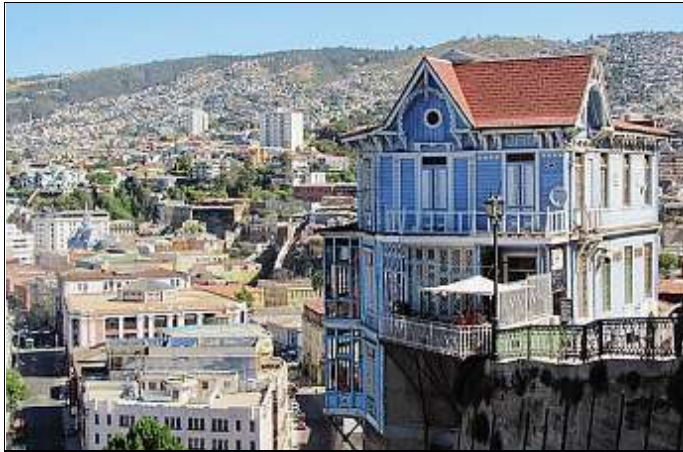
VALPARAÍSO. La ville inscrite au patrimoine mondial de l'humanité ne compte pas moins de 41 collines.

Sept millions d'habitants, y vivent, soit un tiers de la population du Chili. Sa position centrale, sa vie culturelle et économique réalisent l'impossible : l'unité d'un pays de 4.300 km de long, coincé entre le Pacifique et les Andes. Pourtant, le 11 septembre 1973, ce pays se fracturait en deux. Une junte militaire bombardait le palais de la Moneda et assassinait Salvador Allende, son président, pour porter au