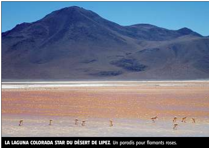
LA LAGUNA COLORADA STAR DU DÉSERT DE LIPEZ. Un paradis pour flamants roses.

Les uns affirment que c'est possible en vélo et l'ont fait, les autres que non. Je ne sais quelle décision prendre. Je consulte les dignitaires pré-colombiens de la nécropole de San Juan qui en rient encore dans leurs tombes de lave millénaire. Plus pragmatique un chauffeur affirme que par Alota et Vilamar il ne devrait pas y avoir de problème. J'y vais ! Le salar de Chiguana est démesuré. La gigantesque langue de sel écarte la cordillère aux nuances de brun violet pour gagner son horizon. Quelques vigognes broutent là où il n'y a rien et s'enfuient à mon approche. Puis c'est l'accès avec poussage