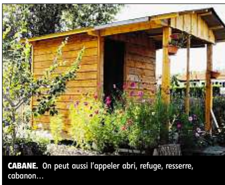
CABANE. On peut aussi l'appeler abri, refuge, resserre, cabanon...

La deuxième étape a été le stockage correct du bois, pour qu'il sèche pendant une année dans les conditions idéales, afin de