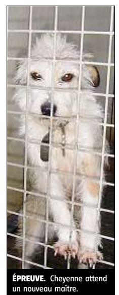
ÉPREUVE. Cheyenne attend un nouveau maître.

➔ Contacts. Association Protectrice des Animaux. Le Bas Charmet à Gerzat (Fléché à partir de la caserne des pompiers et du commissariat, rue Anatole France) Ouvert de 10 heures à