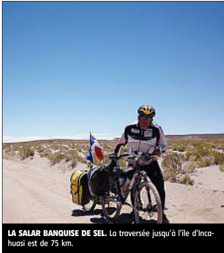
LA SALAR BANQUISE DE SEL. La traversée jusqu'à l'île d'Incahuasi est de 75 km.

S alar de Uyuni : unique ! J'abandonne Potosi et ses rues animées pour faire connaissance avec la piste Bolivienne. Le choc est de taille et j'ai l'impression d'avoir tenu un marteau-piqueur toute la journée. Aussi lorsqu'un bus me cueille au crépuscule dans un de ces petits villages de montagne qui servent de relais routiers, je me laisse faire et débarque en pleine nuit à Uyuni. 30 km de piste caillouteuse et ensablée me ramènent à Colchani, village d'entrée du salar. Hélas une forte tempête de sable me contraint à passer la nuit dans un hôtel de sel. Le lendemain la traversée en direction des îles qui émergent de ce vaste univers débute sous une pluie glacée vent de face. Je roule à 13 km/h. Le ciel est laiteux et les traces grises des 4x4 sont effacées par le blanc-man-