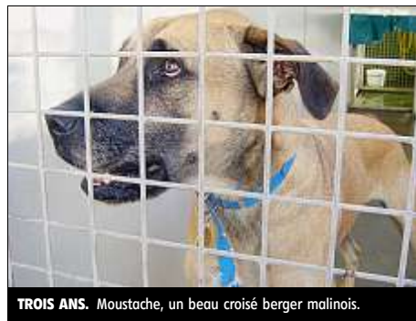
TROIS ANS. Moustache, un beau croisé berger malinois.

Un chien du divorce... Maîtres séparés, Moustache abandonné au refuge de l'APA depuis juillet. Gentil comme tout, ce beau croisé berger malinois de 3 ans a bien du mal à s'en remettre.