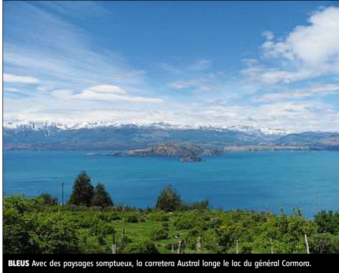
BLEUS Avec des paysages somptueux, la carretera Austral longe le lac du général Cormora.