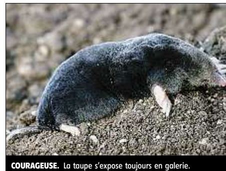
COURAGEUSE. La taupe s'expose toujours en galerie.

Essayons d'en apprendre un peu plus sur cette petite bête, honnie souvent, et bien méconnue, car on rencontre rarement cette grande timide. 15 à 20 cm de long, 100 à 140 grammes, des yeux minuscules (ne dit-on pas « myope comme une taupe » ?), elle a un curieux museau en pointe, terminé par un os formant boudoir, servant aux repérages. Son odorat, très puissant, la guide sans faillir, et ses pattes