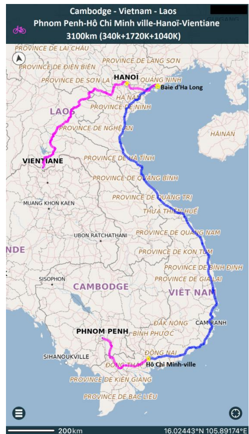
Itinéraire projeté de Mars à Mai 2024